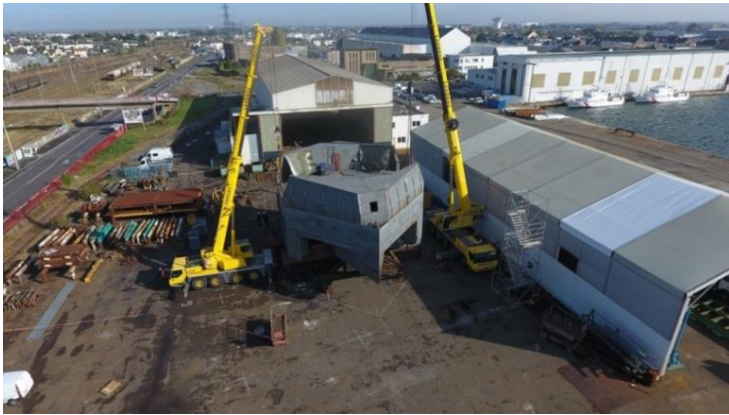
Assemblage Octobre 2018