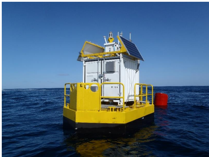
Plateforme Wavepearl en opération commerciale au large d'Oléron

Le projet IHES s'appuie sur la réussite d'un projet collaboratif précédent, le projet PMH, qui avait permis de valider et commercialiser le même type de plateforme en version basse puissance pour des applications de mesure en mer.