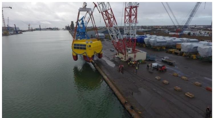
Mise à flot – 5 Décembre 2018