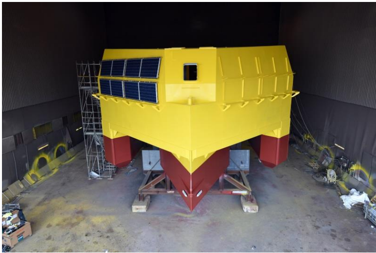
Peinture Novembre 2018 ©Centrale Nantes